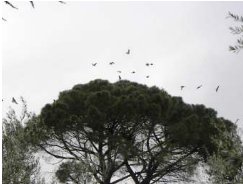
Figura 2 Grillai che volano attorno alla chioma dell'albero prima di posarsi

Il Parco per il Grillaio 2010. Attività di conservazione del falco grillaio: recupero pulli, divulgazione e monitoraggio