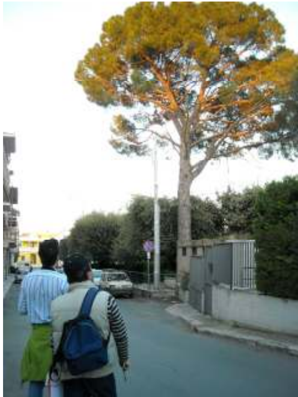
Figura 1 Volontari impegnati nella conta dei grillai presso un dormitorio (pino domestico)