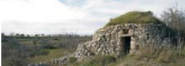
Antiche quotizzazioni, nelle quali veniva coltivato mandorlo spesso anche in consoziazione con olivo, oggi rinaturalizzate.