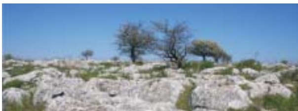
Pascolo caratterizzato da roccia calcarea affiorante (campo carreggiato).