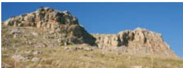
Habitat rupestre sul costone murgiano.