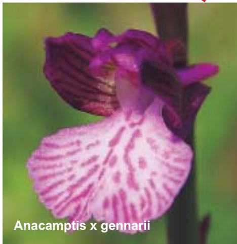
Esempio di specie ibrida.

essere "sterile". In quest'ultimo caso, anche se meno frequente, l'individuo che osserviamo è unico e non ne genererà altri. Questo è uno dei motivi che, peraltro, complica enormemente la possibilità di identificare in maniera univoca un certo esemplare. Una complicazione ulteriore è dovuta alla possibilità che gli ibridi possano incrociarsi con le forme parentali ( introgressione ), dando vita a forme ancora più fantasiose e suggestive.