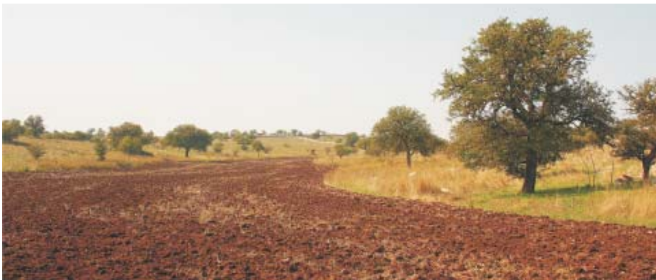
Il recupero del tradizionale utilizzo del territorio dell'Alta Murgia, fatto di lame coltivate e versanti pascolati, rappresenta un modello di sviluppo economico utile anche ai fini della conservazione degli habitat delle orchidee.

Il "Piano per il Parco", con la normativa e le strategie individuate, ritiene l'attività agricola tradizionale un importante strumento per conseguire i fini di protezione in linea con i bisogni della popolazione locale. Se a questo aggiungessimo la capacità di inserire questo territorio in quel grande strumento mediatico che è il Mediterraneo, da sempre percepito come terra di biodiversità, cultura, sapori e profumi, porremmo le basi per un processo di protezione duratura e coerente con questi luoghi.