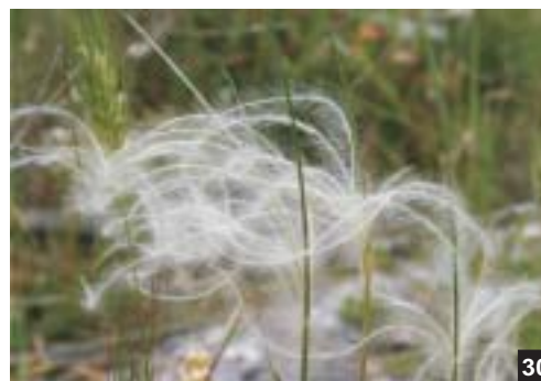
I. Strada interpodereale - II. Fioritura di Stipa austroitalica sul costone murgiano - III. Pascolo arborato