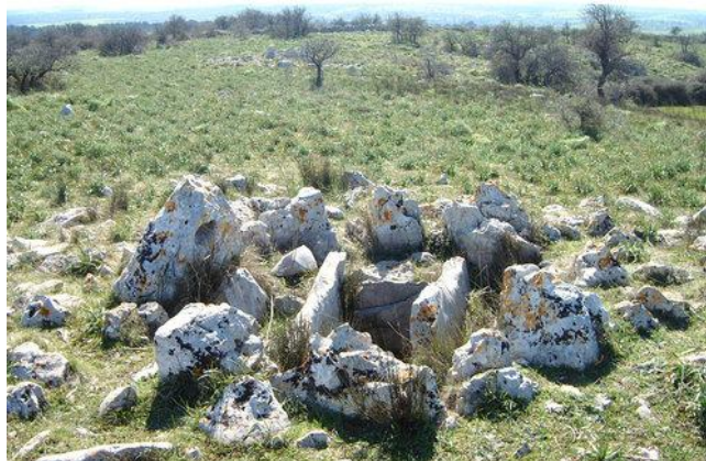
Tomba a tumulo – Necropoli di San Magno