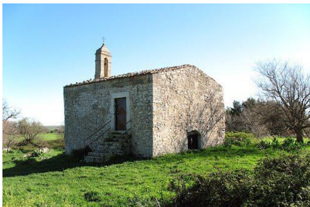
Chiesetta - Neviera di San Magno